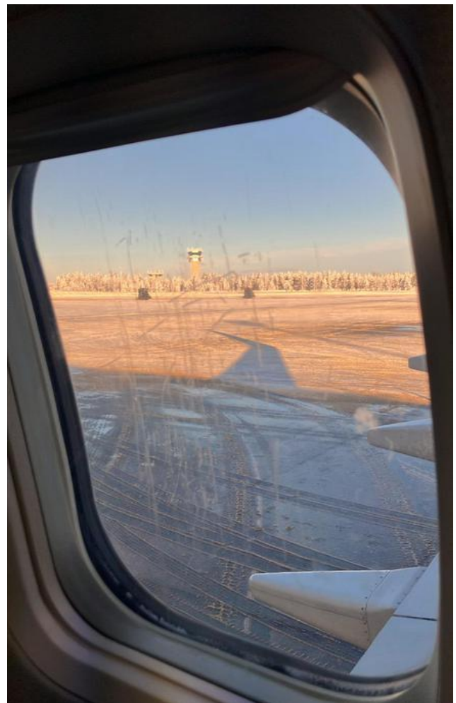
Quand te reverrai-je, pays merveilleux....