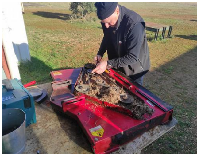
Il cherche l'aiguille