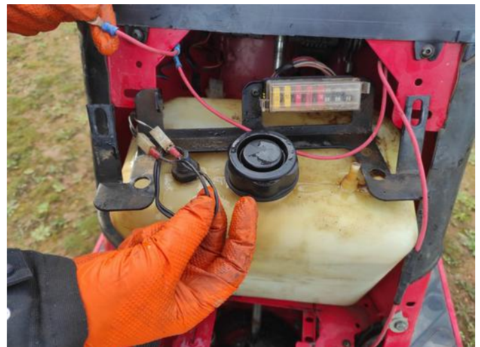
il a déjà le fil.

A l'heure où j'écris ces lignes, l'opération est toujours en cours et en bonne voie.