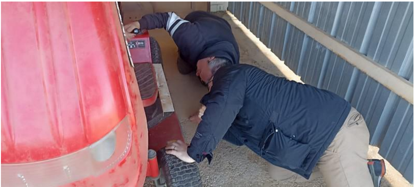
Les dessous de l'histoire.

L' A.U.A.B.L.F. que nous remercions, a eu la généreuse et bonne idée de faire don au C.A.R.E.B. d'une superbe tondeuse auto-portée pour cause de double emploi. Cette machine ayant bravement servi depuis un bon nombre d'années, notre fine équipe de mécaniciens s'est chargée de la remettre en état. L'opération tondeuse est lancée.